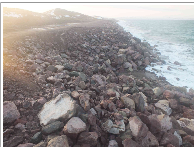
Effondrement central (disparition des blocs en partie basse)