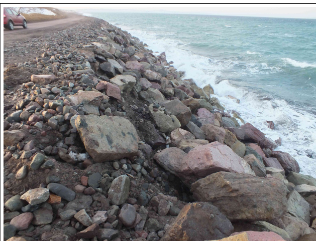
Effondrement sur la zone du parking amont