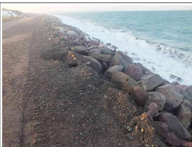
Glissement et renards aval