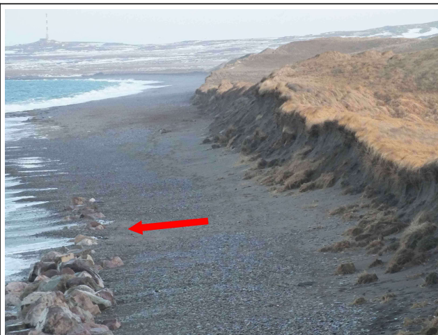
Enfouissement de l'extrémité du cordon d'enrochement